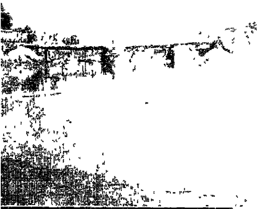
मन्देई का पुल भूकम्प के बाद बाँस लकड़ी का बना हुआ